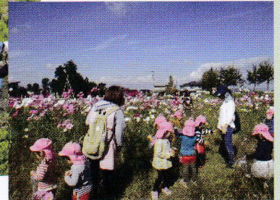
農地等を活用した景観形成

★戦時中、当地区に学童集団疎開された方から77点の当時の農村生活を偲ぶイラスト画を提供いただきました。地域の「歴史」や「農村文化の伝承」も地域資源であるとの新たな気づきがありました。これからは隠れた地域資源を発掘し活気ある活動につなげていきたいと考えています。