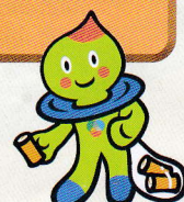
滋賀県イメージ キャラクター うおーたん