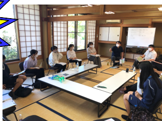
2021やまだアドベンチャーハウス 企画チャレンジャー会議

毎年開催しているアドベンチャーハウスの企画から準備進行を担い、小学生と一緒に感動する1日を作りませんか?