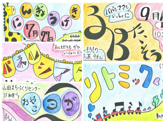
色とりどりの素敵な手作りポスター

今年度のにこにこサロンは、未就園児とその家族を対象に、人形劇・3B体操・親子リズム体操・パネルシアター・親子ヨガの全5回を開催しました。当日は、新型コロナ対策として、参加親子の体温測定・部屋の換気・マスク着用（未就園児は免除）などを実施した